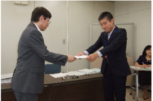
要求書を提出する愛媛県国公の代表 合同庁舎

6月20日(金)香川県教職員組合は、四国ブロックの国家公務員や教職員組合の仲間と共に、松島町にある合同庁舎を訪れ、人事院が、2014年度から国家公務員の給与を削減する制度の見直しを絶対しないように訴えました。人事院が提示する国家公務員への勧告で、マイナスの勧告ができれば必ず地方公務員にも影響することから、通常この時期には話し合いを持つことがないにもかかわらず、給与カットはしないほしいと要求書を提出したものです。