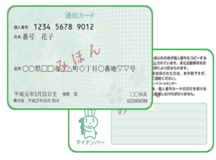
通知カード (見本)

10月5日、マイナンバー法(行政手続きにおける特定の個人を識別するための番号の利用等に関する法律)が施行されました。10月20日から順次個人番号(マイナンバー)を知らせる通知カードが郵送されます。個人番号の利用についての法律の施行は2016年1月からです。知れば知るほど、国民に大きなリスクを背負わせる制度。開始にあたって知っておきたいポイントをまとめてみました。