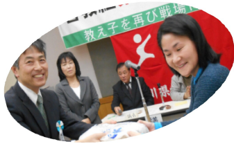
全教自動車保険に加入 ドライブレコーダー 当選!