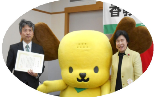
総合共済過去最高の加入者 を迎え表彰されました

ついて語っています。「教育の中で正しいことを教えたい」とそう思います。正しいことは平和。組合は大切です。平和を守る力を結集しましょう。