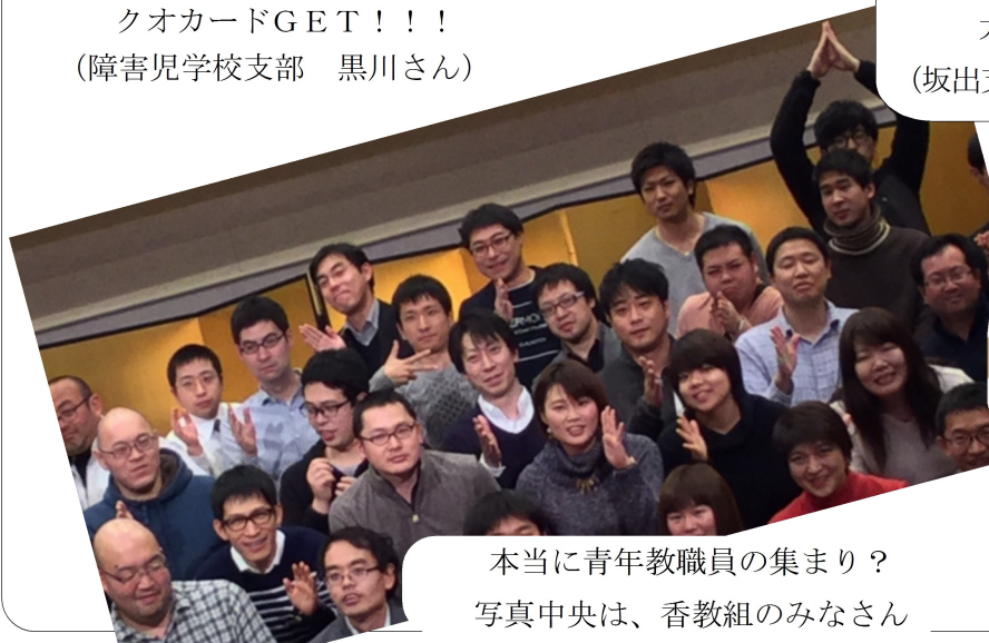
本当に青年教職員の集まり？ 写真中央は、香教組のみなさん

2月4日～5日全国青年教職員学習交流集会在富山県砺波市で開催されました。香教組からも青年教職員が参加しました。山の裾野まで銀世界を目的の当たりにしながら、全国の青年教職員と大いに学び交流した2日でした。