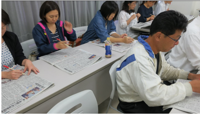
赤ペンを片手に実践する参加者

参加者は赤ペンを片手に、「これならできそう」「政治や経済分野は苦手だけど、意外と面白いことがわかった」「テレビ欄がこんなに面白いものとは思わなかった」「世界地図の使い方も面白いと思った。今日もらった地図を有効に使ってみたい。」などの感想が寄せられました。早くも第2弾のご要望がありました。