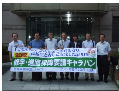
四国就職キャラバン一行(県教委前)

http://www.niji.or.jp/home/kakyoso/homepage