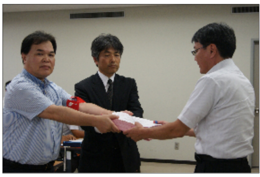
給与署名を提出する県・高教職員長=9.4