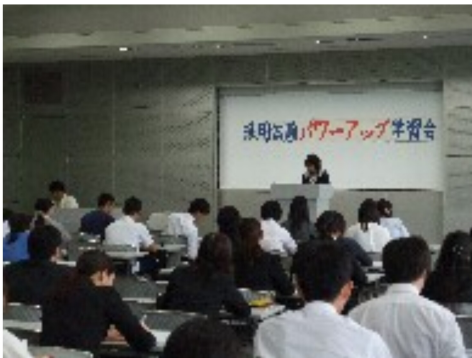
2015年度 パワーアップ面接講座

臨時教職員は、正規採用の教職員と同じように働いていますが、身分は不安定で待遇も決してよくありません。香川県では、2016年度春に採用された教諭は小・中・県立学校で約310名です。しかし、学校現場では多くの先生方が講師として働いています。講師のみなさんには「早く採用されたい」「講師の経験を採用試験で尊重してほしい」「みんながどのように勉強しているのかわかりたい」など様々な願いがあります。この学習会に参加し、香川県の採用試験のノウハウや学習の仕方などわかります。ぜひご参加ください。