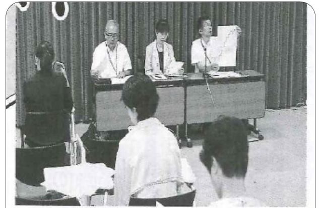
文科省記者クラブでの記者発表（3月6日）