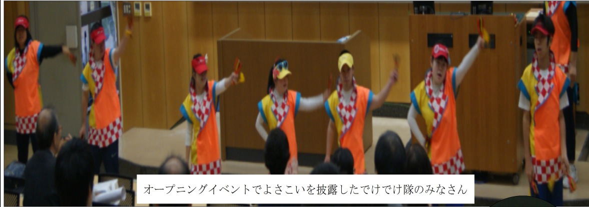
オープニングイベントでよさこいを披露したでけ隊のみなさん

教育行政キャラバンが始まります。11/19(月)～11/22(木)まで。各市町で教育に関する要請をしていきます。