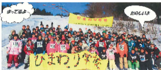
障害児学校支部 毎年行われる「ひまわり学校」