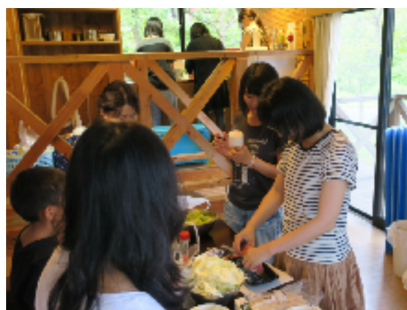
青年部 BBQ ホットステイまんのう