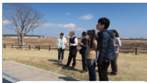
「そうだ！福島へ行こう！」 地震・津波・原発事故について学ぶ