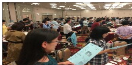
「全国女性教職員学習交流集会in北九州」