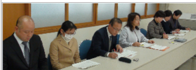
職場の様々な要求を県教委と交渉

香教組は、1947年（昭和22年）の結成以来、一貫して教職員の生活や権利を守り、平和と民主教育を発展させるための運動を続けてきました。現在は、全日本教職員組合（全教）に結集する教職員組合として、香川では香川県高等学校教職員組合（香川高教組）、香川県私立学校教職員組合連合（香川私教連）と力を合わせて活動しています。