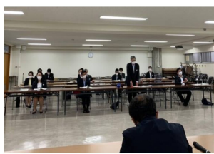
職場の様々な要求を県教委と交渉