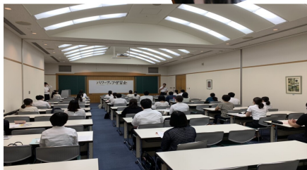
←採用選考試験(パワーアップ)学習会