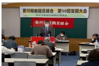
現場の状況や運動方針を話し合う定期大会