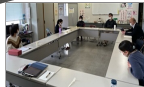
せんせとたまごの学校(青年部)